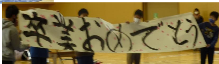
「 てん 天へ か 翔ける りゅう 龍」